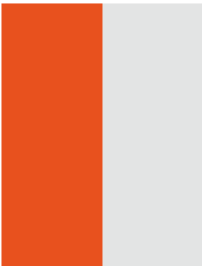
1/2 strony pion: 102,5 x 285 mm + 5 mm spadcu z każdej strony